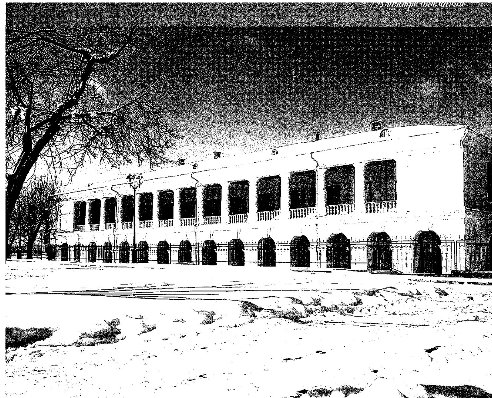
Старинное здание, в котором располагается Академия

В 1998 году согласно Указу Президента РФ в стране появилось новое государственное образовательное учреждение, призванное на самом высоком уровне готовить работников органов судебной власти — Российская Академия правосудия. Учредителями Академии выступили Верховный Суд РФ и Высший Арбитражный Суд страны.